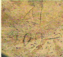
Рисунок росписи вазы соответствует принципам стиля «сецессион», получившего распространение на территории Австро-Венгрии.

На экспертизу представлена фаянсовая ваза с длинными ручками, крепящиеся от нижней части вазы к горлышку.