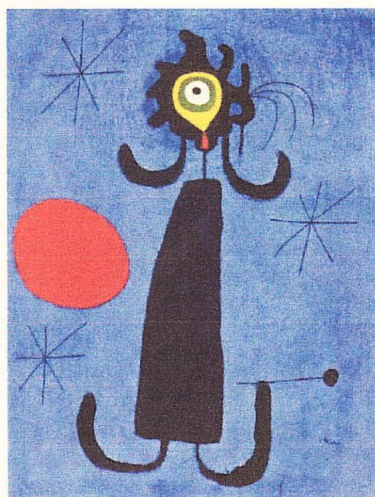
Хуан Миро. "Женщина перед солнцем." 1950 .

25 декабря 1983 Хуан умирает в Пальма де Мальорка.