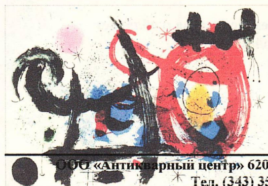
Хуан Миро "Молот без мастера" 1976 г.

ООО «Антикварный центр» 620075, Россия, Екатеринбург, Красноармейская 41