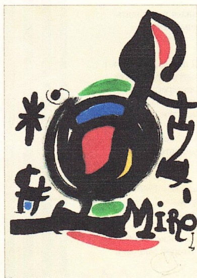
Хуан Миро. "Перелетная птица" 1970 г.